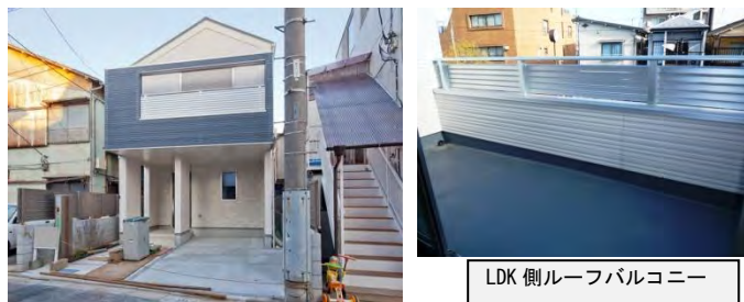
LDK側ルーフトバルコニー

西武池袋線 都営大江戸線 「江古田」駅徒歩7分 「新江古田」駅徒歩6分 (2沿線利用可で通勤通学に便利)