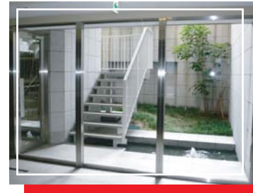
エントランスから見える中庭