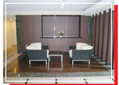
1F ウェイティングルーム