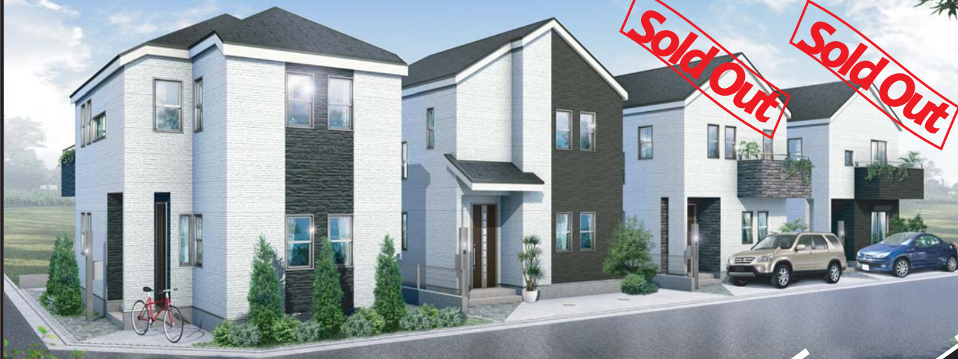
建物完成イメージ図 『フラット35』適用

◆◆◆ 物件概要 ◆◆◆ ◆所在地 練馬区向山1丁目8番12 ◆交通 西武池袋線『中村橋』駅 徒歩5分 ◆総棟数 4棟 ◆今回販売棟数 2棟 ◆価格 C号棟: 5388万円(税込)・D号棟: 5589万円(税込) ◆敷地面積 C号棟: 82.05㎡・D号棟: 76.05㎡ ◆地目 宅地 ◆権利 所有権 ◆建物面積 C号棟: 94.40㎡・D号棟: 99.77㎡ ◆間取 C号棟: 4LDK・D号棟: 4LDK ◆構造 木造2階建 ◆完成予定 平成22年8月下旬 ◆用途地域 第1種中高層住居専用地域 ◆建ぺい率 60% ◆容積率 200% ◆高度制限 第2種高度地区 ◆防火地域 準防火地域 ◆道路 北4M公道、東4M公道 ◆引渡 相談 ◆設備 東京電力・東京ガス・公営水道・本下水 ◆取引態様 売主